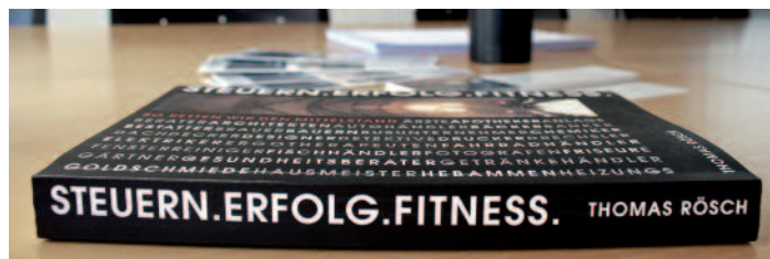
Das VORORT-Buch: ISBN 978-3-00-026986-8