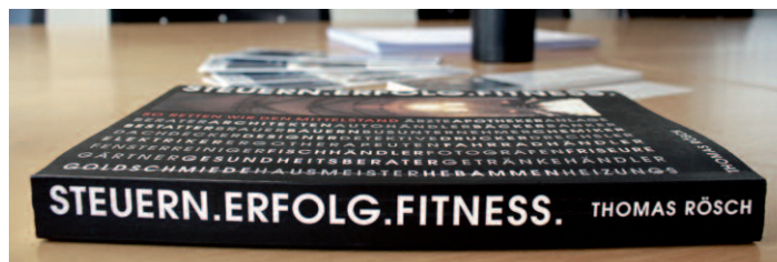
Das VORORT-Buch: ISBN 978-3-00-026986-8

Weitere Infos: www.vorort-ewiv.de www.vorort-steuerberatung.de